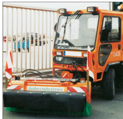
FKM på kommunalkjøretøy uten oppsamler