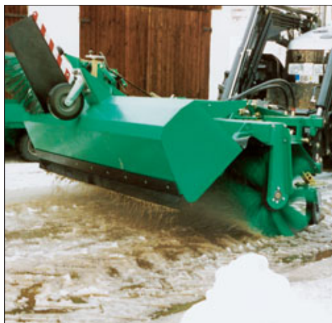
FKM på traktor ved feiing av snø

feiemaskin for frontmontering FKM 1.3/1.6/2.0/2.2/2.5